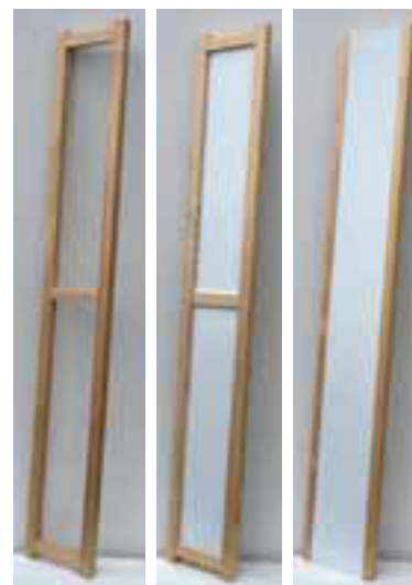
Öppen gavel furu klarlack